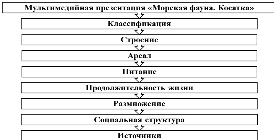
Рисунок 1. Общая структура системы