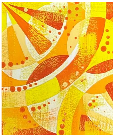
Пример 1. Тема: «Закат»